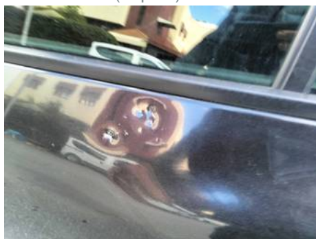
Porte avant gauche (Impact)